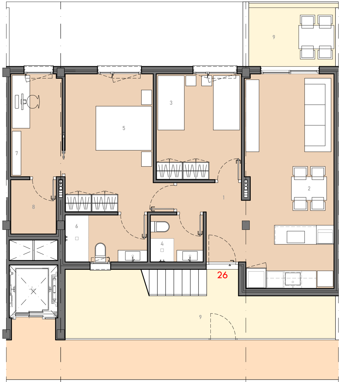
TIPO 8 PLANTA SOBRE CORNISA 2 dormitorios + sala teletrabajo

SECTOR RESIDENCIAL MINIFÉ _ PUERTO SAGUNTO